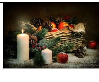
А) Новый год